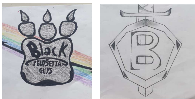
Invenzione del logo del gruppo

Rispetto, invece, all'area di creatività, si è data ampia libertà al disegno (con l'utilizzo anche dei gessetti), ai giochi di società, alle attività musicali, all'invenzione del logo del proprio gruppo, agli indovinelli, ai cruciverba, all'improvvisazione, e, soprattutto, per i più piccoli, la possibilità di assistere a uno spettacolo teatrale insieme ai bambini della scuola dell'infanzia.