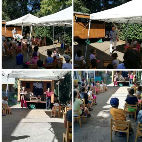
Partecipazione dei piccolini alla rappresentazione teatrale

Grazie a Comune di Bibbiano e Arci Reggio Emilia per aver regalato questa emozione ai bambini della Scuola Infanzia Allende e ai bimbi piccoli dell'Happy Camp