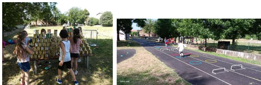
I bambini impegnati nel tiro a bersaglio con i barattoli e nel percorso ad ostacoli

I giochi proposti spaziavano da percorsi a squadre (con cerchi e/o cinesini) o a tempo (anche di agility) o ad ostacoli (in genere, staffette), al dodgeball, fino ai classici sport, quali basket, calcio, pallavolo e tennis. Si sono avanzate, poi, come idee, quelle di palla avvelenata, tiro al bersaglio con i barattoli, rubabandiera, nonché salto, tiro e schivata della fune.